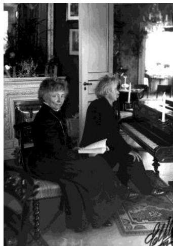
Edvard og Nina Grieg 1804