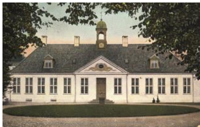
Gl. Holtegård 1905

Mødested: Gårdspladsen foran Gl. Holtegård.