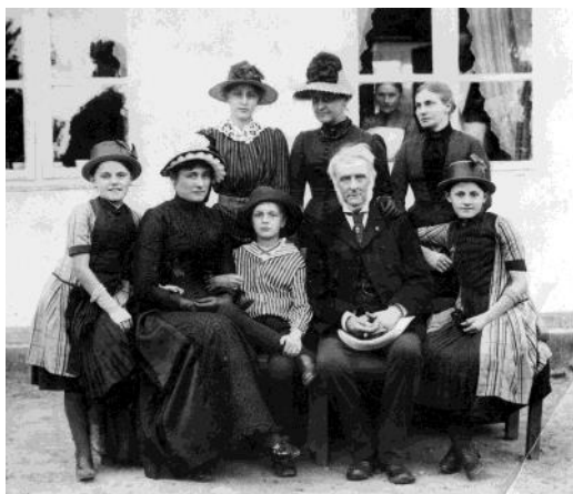
J.P.E. Hartmann med familie i Nærum 1890