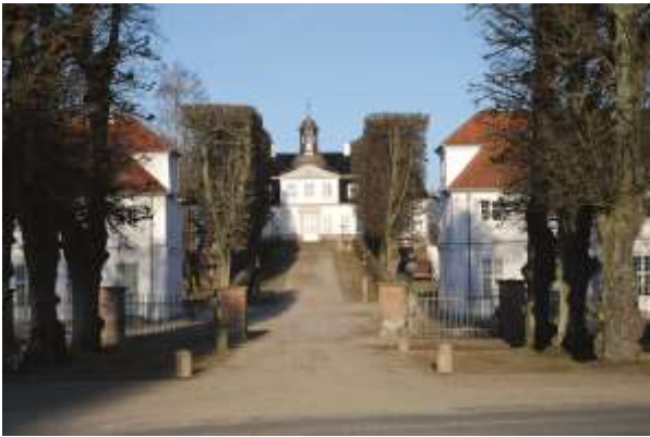
Sorgenfri Slot ↑ Frederik Caspar Conrad Frieboe →