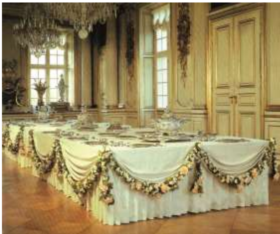
Rekonstruktion af taffelbord fra 1770