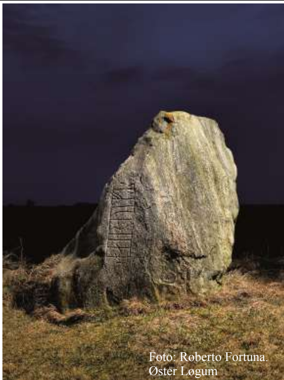
Øster Løgum

Fra den tidlige vikingetid til ind i den tid, hvor danerne var blevet kristne, blev runesten ristet for at mindes nogen og for at sætte sig selv i scene, og stenene blev rejst ved steder i landskabet, hvor folk ville møde dem. Der skulle de stå til evig tid og gøre stenrejserne ære. Runestenene fortæller om blandt andet mandsmod og heltegerninger, selvbevidste kvinder og store bedrifter. I Rudersdal er ikke fundet runesten, men det gør jo ikke emnet mindre interessant.