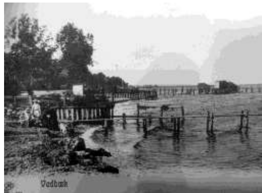
Badeanstalten ved Vedbæk Nordstrand (Rudersdal Museum)